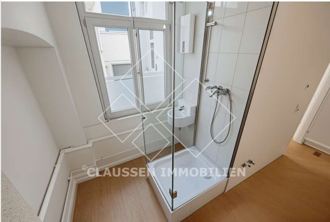
Dusche in Teeküche

Miet-/Kaufobjekt: Miete Büro-/Praxisfläche: 150,00 m 2 Miete pro Monat: 1.200,00 EUR