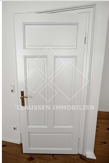
Detail Tür Büro 4