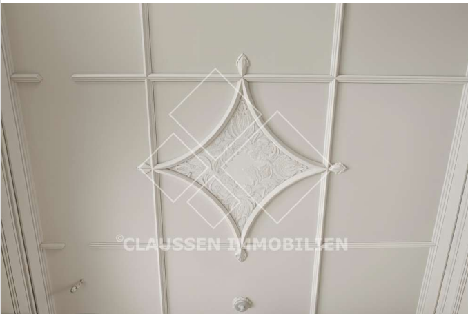
Detail Decke Büro 4